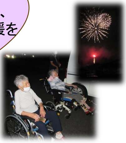
美川の花火を見に行きました