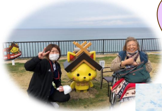
道の駅ゆうひパーク三隅