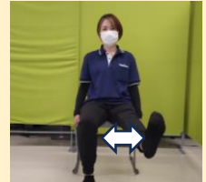
足を伸ばしてつま先を上に向けたまま小さく左右に動かす