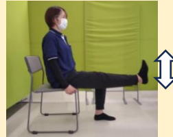
足を伸ばしてつま先を上に向けたまま小さく上下に動かす