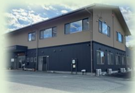
ほっとの家・熱田

医療ニーズのある方も住み慣れた場所で生活できるよう支援するサービスです。 「訪問看護・訪問介護・通い・泊まり」のサービスを1つの事業所で提供します。