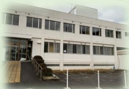
ほっとの家・港町